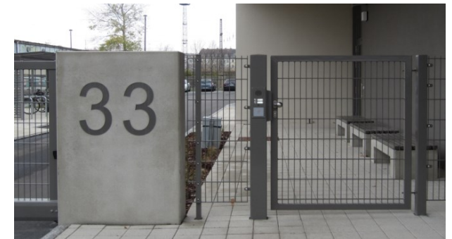
Rettungswache Pieschen Dresden 2015 (E: BAUpro GmbH Radebeul)