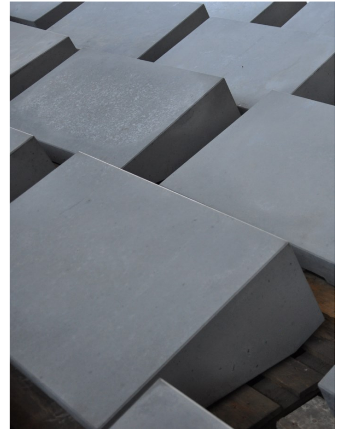
Denkort Bunker Valentin Bremen 2015 (E: GfG / Gruppe für Gestaltung GmbH)

035797/73501 info@jkg-beton.de www.informbeton.de