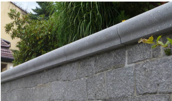
Mauerabdeckplatten Privatgarten Kamenz 2015