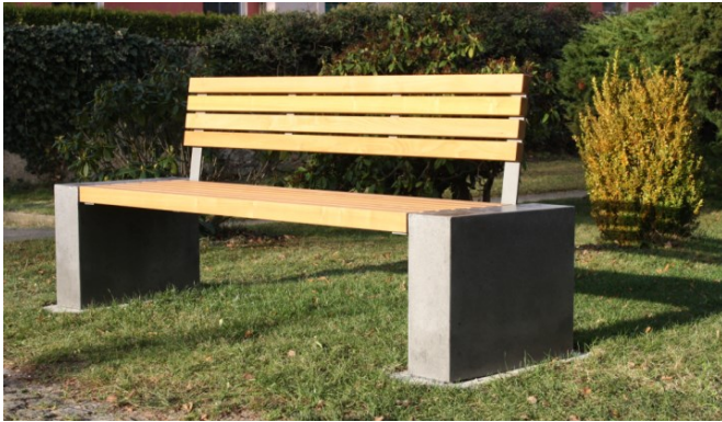
Kirchgemeinde Schwepnitz 2015