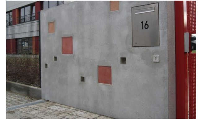
KITA Roquettestraße Dresden 2014 (E: LA-Büro Dr. Eichstaedt-Lobers)