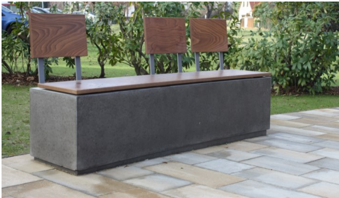
Sowjetisches Ehrenmal Schwepnitz 2015 (E: May Landschaftsarchitekten)