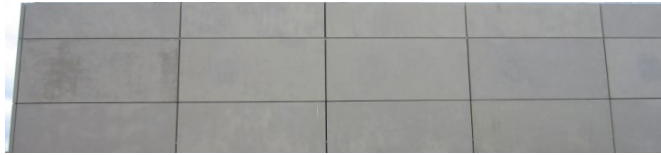
Rettungswache Albertstadt Dresden 2015 (E: RiegerArchitektur)